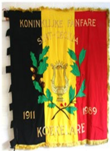
7 Koninklijke Fanfare Sint-Cecilia 1989