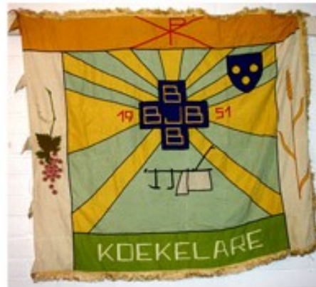
60 BJB Koekelare