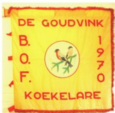
65 BOF De Goudvink Koekelare 1970