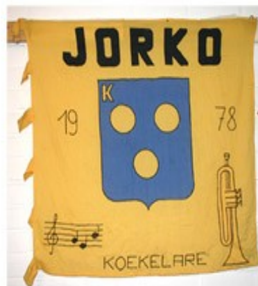
16 Jorko 1978