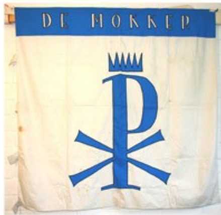
45 De Mokker