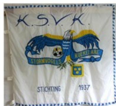
69 KSVK 1937