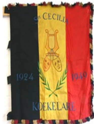
6 Ste Cecilia 1924-1949