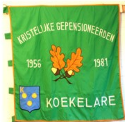
40 Kristelijke Gepensioneerden Koekelare 1956