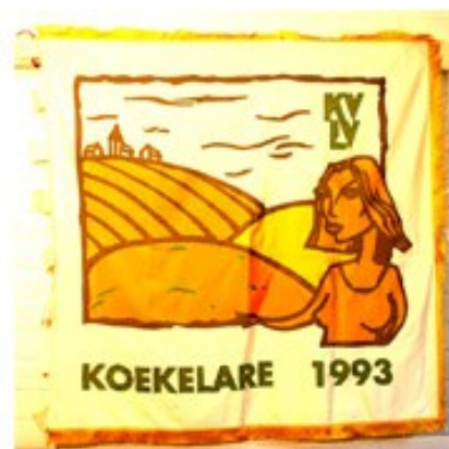
64 KVLV Koekelare