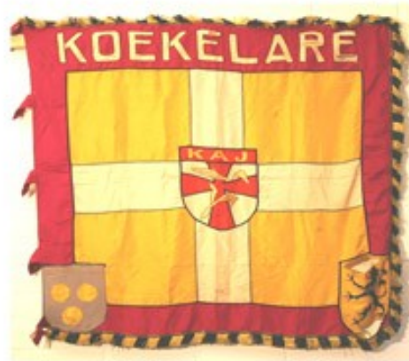
51 KAJ Koekelare