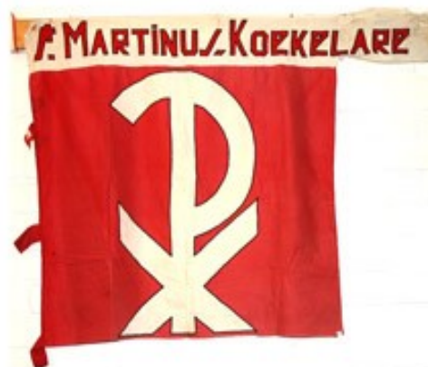
44 St-Martinus Koekelare