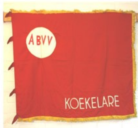
38 ABVV Koekelare