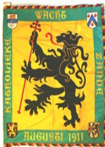
8 Katholieke Wacht Zande 1911