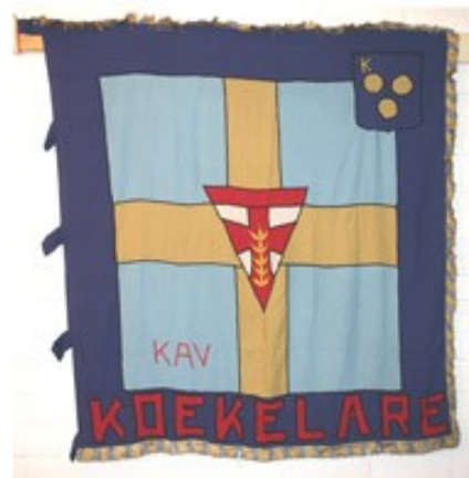
52 KAV Koekelare