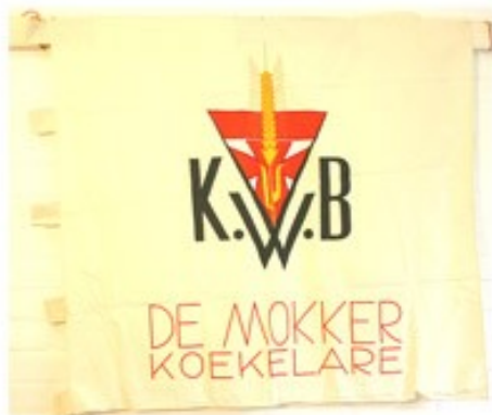
54 KWB De Mokker