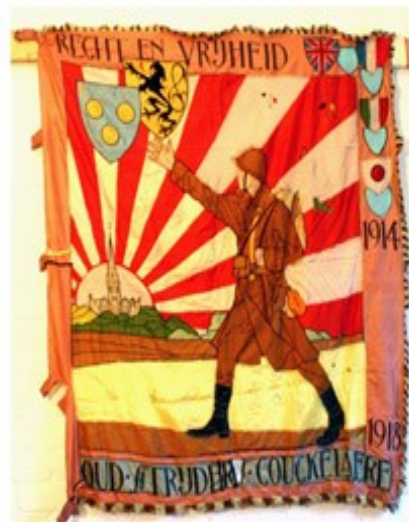
18 Oud-Strijders Couckelaere 1920