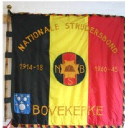
31 NSB Bovekerke