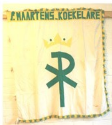
43 St Maarten Koekelare