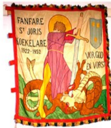
13 Fanfare St-Joris 1951