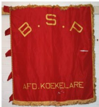
35 B.S.P. Koekelare