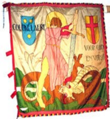
12 Sint-Jorisfanfare Couckelare