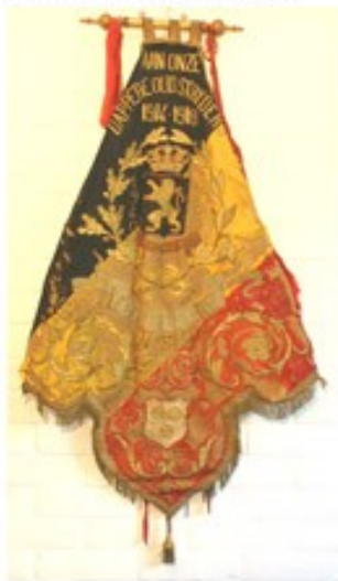
27 NSB Koekelare 1928