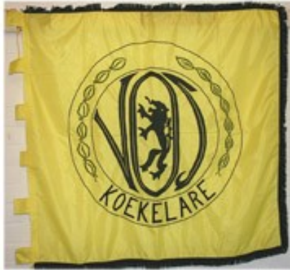
19 VOS Koekelare 1974