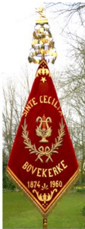
49 Sint Cecilia 1874-1960 Bovekerke