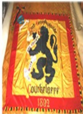
2 Sint-Genesiusgilde 1892