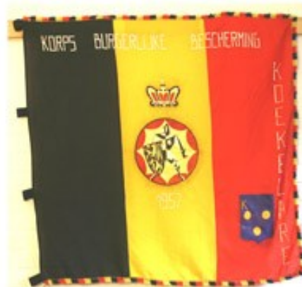
42 Korps Burgerlijke Bescherming 1957