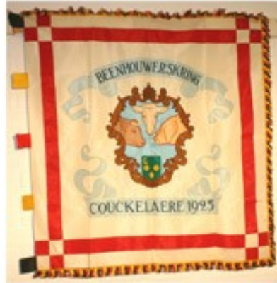
20 Beenhouwerskring Couckelaere 1923