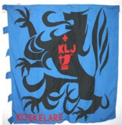
62 KLJ Koekelare