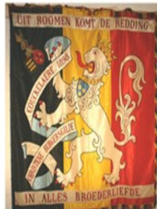
3 Christene Burgersgilde 1898