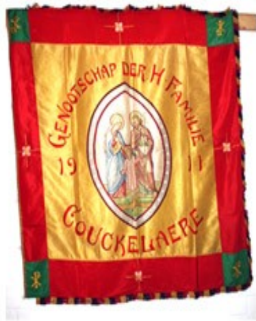
9 Genootschap der H. Familie Couckelaere 1911