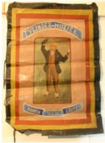
21 T'Vlindermuziek 1930