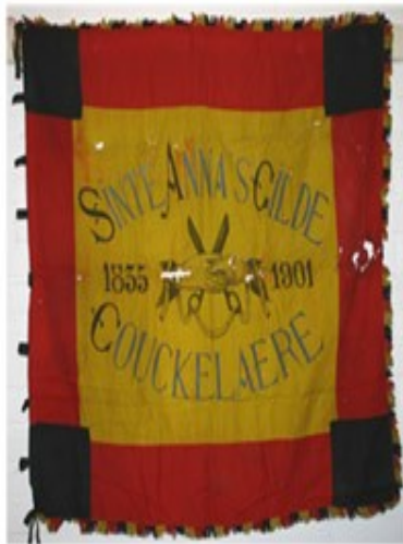
4 Sinte Anna's Gilde 1901