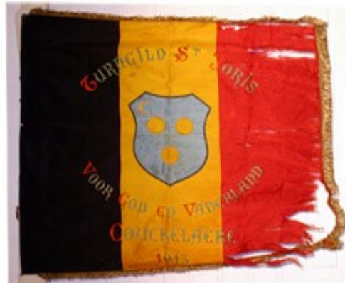
11 Turngilde St Joris 1913