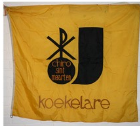
46 Chiro Sint Maarten